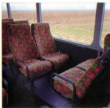
Gut erreichbare Sitze

Diese neue Variante des seit Jahren erfolgreichen Linienbusprogramms ist besonders fahrgastfreundlich. Über die stufenlosen Ein- und Ausstiege können alle Fahrgäste – auch Behinderte, ältere Leute und Mütter mit Kinderwagen – mühelos den Innenraum erreichen. Der Nutzen: Zeitsparender, reibungsloser Fahrgastfluß und damit mehr Attraktivität für den Überlandverkehr.